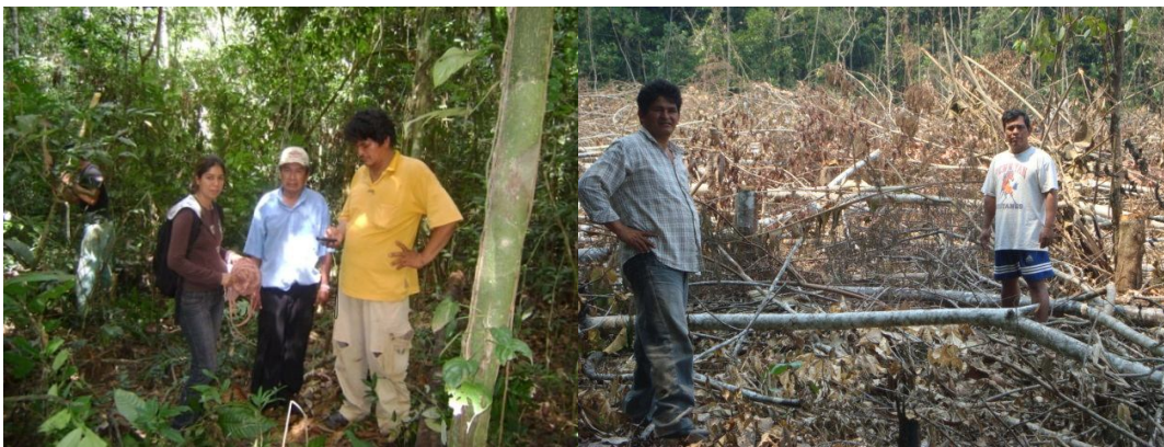
Fotos del plan de desmonte e inspecciones in situ en comunidades

Se elaboró una cartilla de capacitación, basado en las Leyes 1700 y 1333 sobre Manejo y Control Forestal y Ambiental, con el fin de socializar estas Leyes y concientizar sobre los daños ambientales, la extracción ilegal de madera y otros, que fue difundido en comunidades campesinas e indígenas y a Unidades Educativas que lo solicitaban.