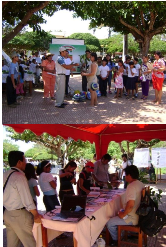
Fotos de la Feria en la Plaza 3 de Febrero

Asimismo en el mes de octubre se coordinó y realizó la feria exposición en conmemoración al 2 de octubre, “ Día Nacional del Árbol ”, en coordinación con las instituciones involucradas con el tema: Universidades, Dirección Distrital de Educación, MAMUNAB, Organismos Gubernamentales y No Gubernamentales, Proyectos y otros. Se tuvieron buenos frutos ya que al igual que en la anterior feria, la Dirección de Educación involucró a los estudiantes y a la población de Riberalta, ya que se llevó a cabo en el Parque Ecológico “El Siringalito” .