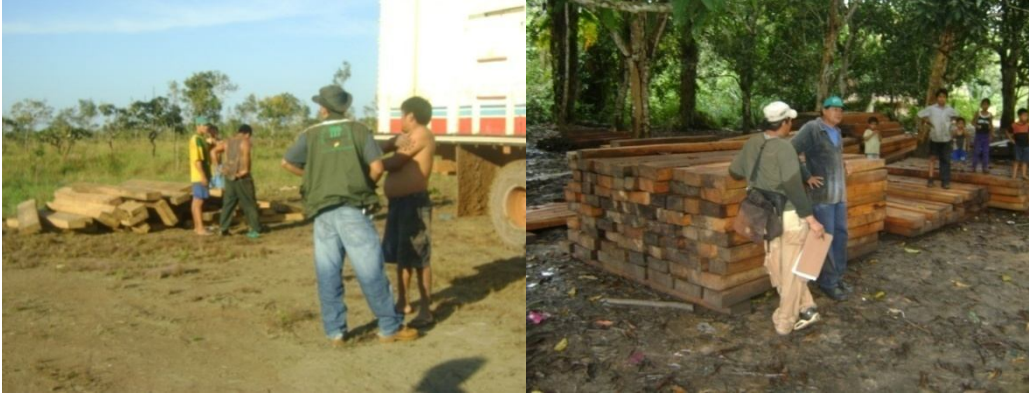
Fotos de la inspección in situ en carretera y comunidades

Visitas a la comunidad Puerto Chacobo, lugar de alta extracción ilegal.