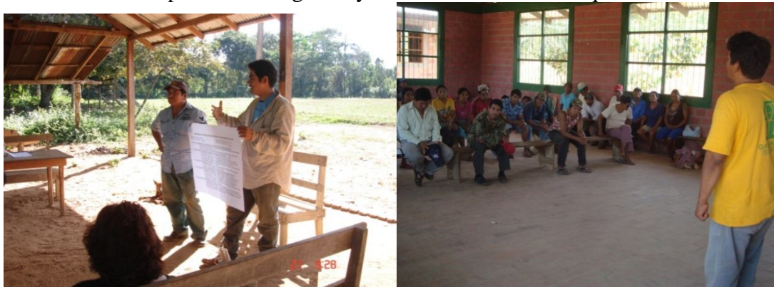
Fotos de las capacitaciones en las comunidades campesinas

Se elaboró una cartilla de capacitación, basado en las Leyes 1700 y 1333 sobre Manejo y Control Forestal y Ambiental, con el fin de socializar estas Leyes y concientizar sobre los daños ambientales, la extracción ilegal de madera y otros, que fue difundido en comunidades campesinas e indígenas y a Unidades Educativas que lo solicitaban.