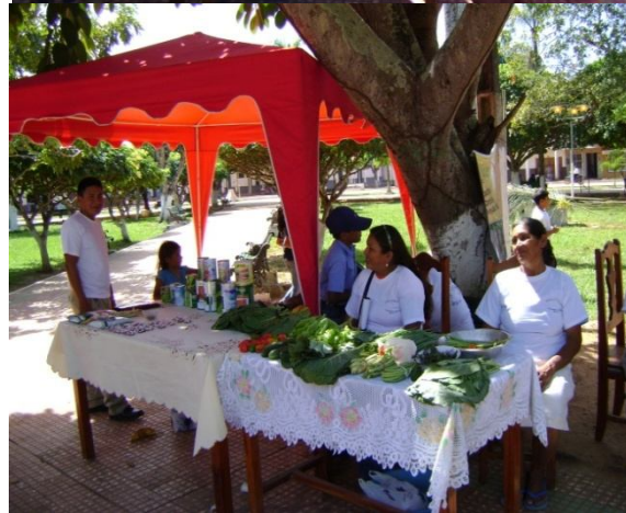
Participación en la Feria del Día del Medio Ambiente