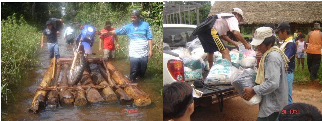
Fotos de la supervisión para EDA y entrega de vituallas