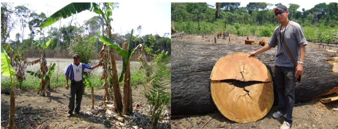
Fotos de los pasantes en inspecciones